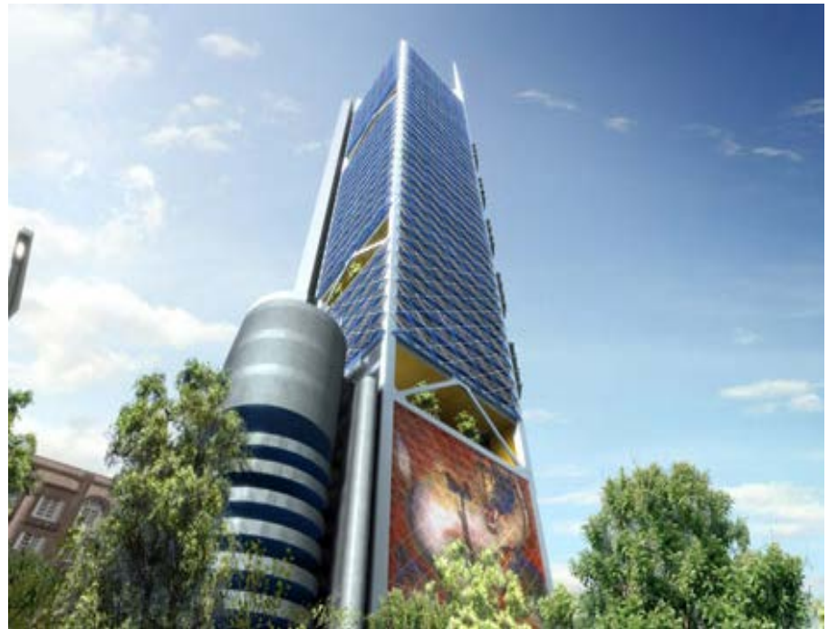
Future torre de BBVA Bancomer que se encuentra en construcción en la Ciudad de México.

El Grupo BBVA tenía registrados a 31 de diciembre de 2012 un total de 9.871 millones de euros en impuestos diferidos de activo, y un total de 2.883 millones de euros en impuestos diferidos de pasivo.