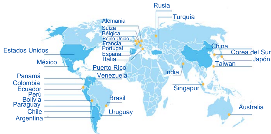
Presencia de BBVA en el mundo

El siguiente gráfico muestra un desglose de los impuestos totales pagados en cada región en el ejercicio 2012.